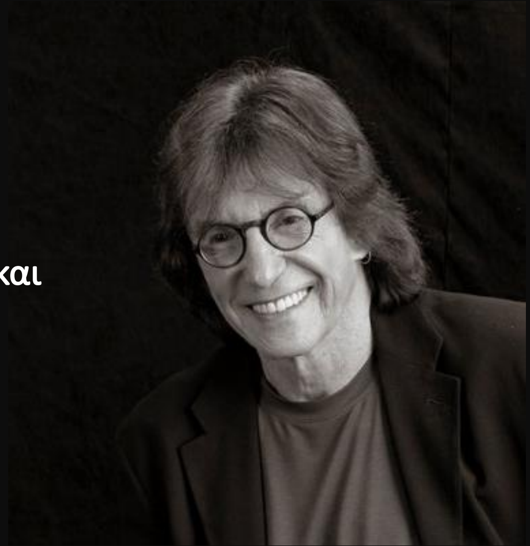
Henry A. Giroux

σύνδεση της παιδαγωγικής με το κοινωνικό και πολιτικό καθήκον της αντίστασης, της χειραφέτησης, του εκδημοκρατισμού