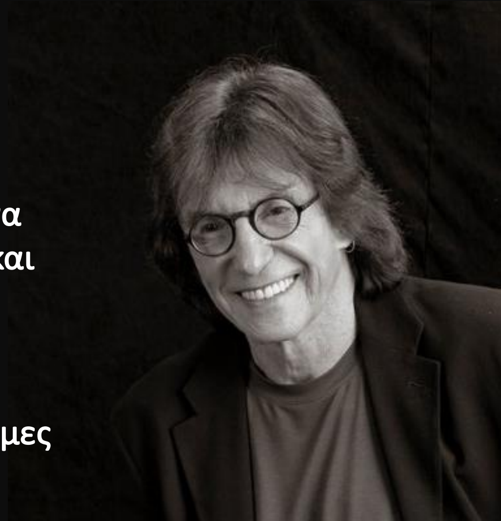
Henry A. Giroux

... [pedagogy is never] removed from matters of values, norms and power